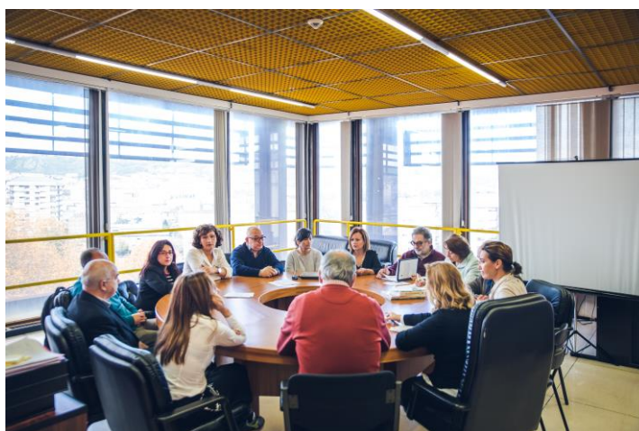
Imaxe 1. Reunión entre docentes dos respectivos Graos do Centro

De modo sintético, en diante, realízase unha descrición analítica, atendendo aos respectivos títulos, sobre as accións de coordinación desenvoltas ao longo do curso académico 2016-17, en función das súas distintas tipoloxías e niveis de coordinación. A De modo ilustrativo apórtase a imaxe 1, na que se desenvolve unha reunión entre profesorado dos distintos graos do Centro, para tratar cuestións asociadas co TFG e o Prácticum.